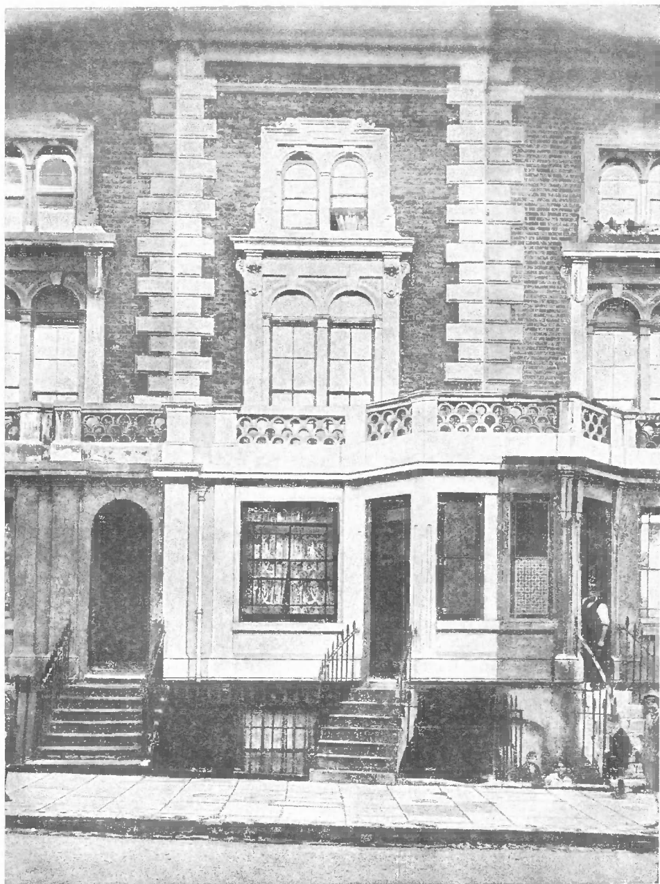
Дом в Лондоне (9, Graftonterrace, Maitlandpark), в котором жил МАРКС с 1857 до 1868 г.