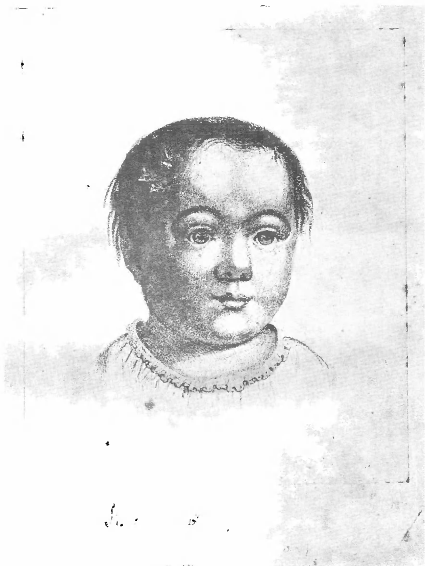
СЫН МАРКСА «МУШ». (1849 — 1855.)